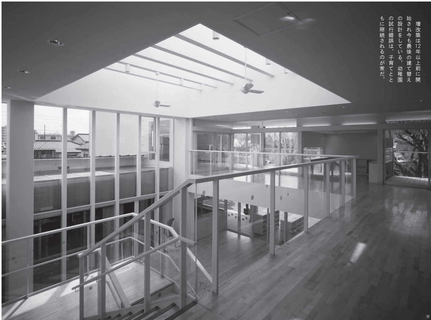
●所在地 東京都八王子市・建築主 学校法人白峰学園・構造 中設計・施工 清水組・フローリング ウッディーワールド・敷地面積 2710.78㎡・延床面積 836.15㎡・S造2階建・竣工 2006年・撮影 永石秀彦 ※

増改築は12年以上前に開始され、今も最後の建て替えの設計をしている。幼稚園の試行錯誤は、子育てとともに継続されるのが常だ。