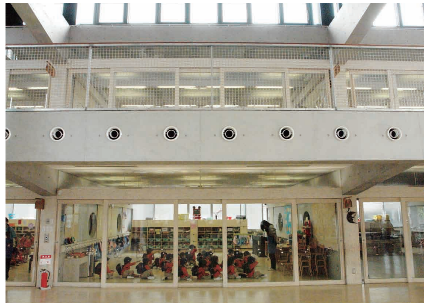
●所在地 東京都調布市・建築主 学校法人東京キッズ学園・構造 中設計・施工 砂川建設・敷地面積 3726.09㎡・延床面積 2002.71㎡・RC造+S造2階建・竣工 2005年