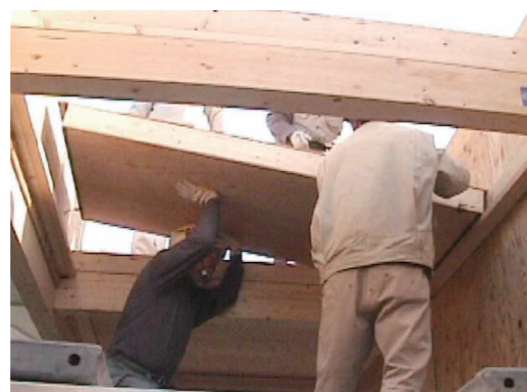
●所在地 東京都日野市・建築主 社会福祉法人至誠学舎立川・構造 中設計・施工 竹中工務店・敷地面積 674㎡・延床面積 391.72㎡・木造2階建・竣工 2001年 ※